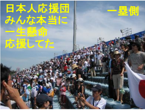
日本人応援団みんな本当に一生懸命応援してた