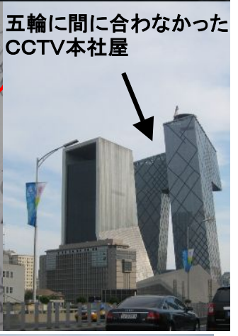
五輪に間に合わなかったCCTV本社屋