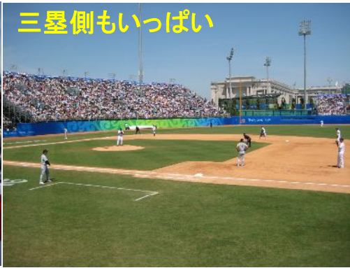
三塁側もいっぱい