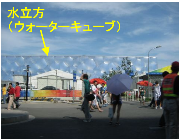
水立方 (ウォーターキューブ)