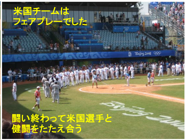
米国チームはフェアプレーでした